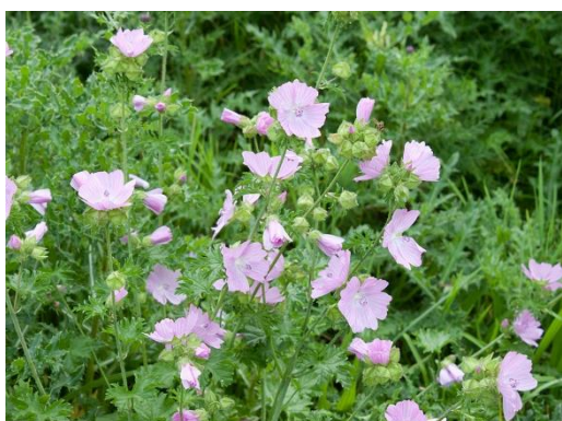
13. Muskuskaasjeskruid ( Malva moschata )