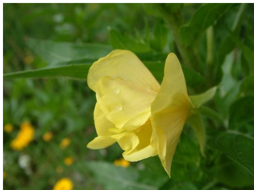
15. Middelste teunisbloem ( Oenothera biennis )