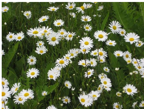
12. Gewone margriet ( Leucanthemum vulgare )