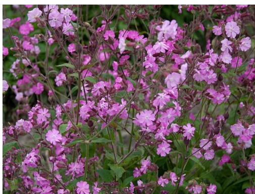
17. Dagkoekoeksbloem ( Silene dioica )