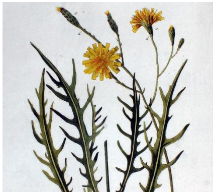
11. Vertakte leeuwentand ( Leontodon autumnalis )