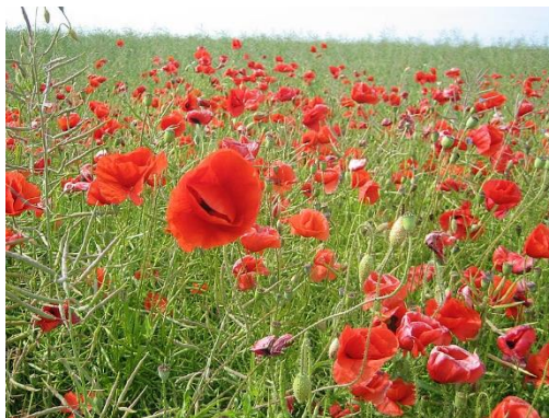
16. Grote klaproos ( Papaver rhoeas )